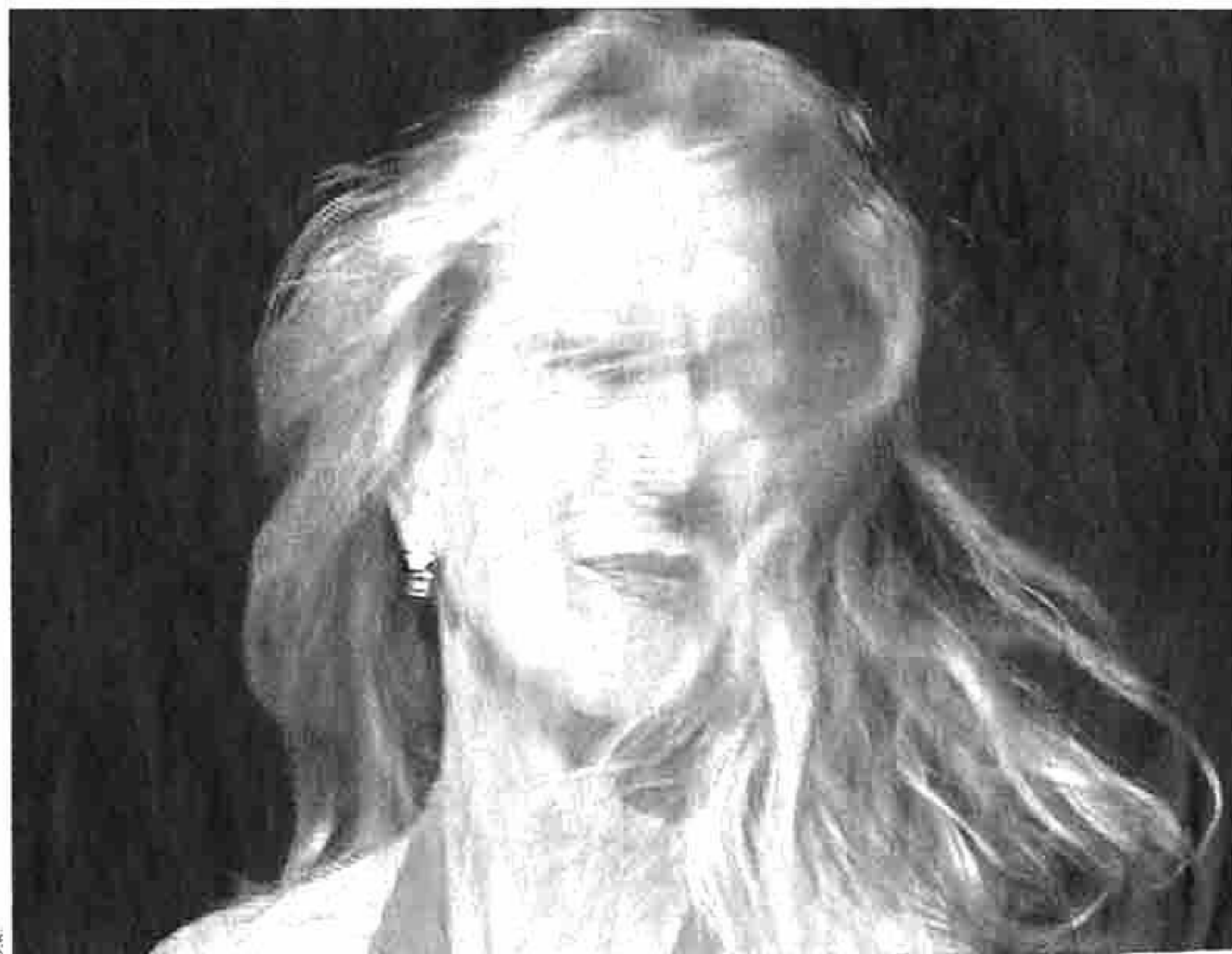
« Blonde Unfuckingbelievable Blonde », de Marielle Pinsard.

remment le sujet. Elle mêle à la fois la dissection entomologiste et la protection de l'espèce en voie de disparation – les trois quarts de la population du globe naît avec des cheveux noirs. A New York et à Genève, où elle vit, elle a mené des centaines d'interviews avec des femmes blondes de tous âges. « Aucune blonde ne veut reconnaître que c'est plus facile pour elle avec les hommes, que parfois leurs poses nunuches sont sidérantes, on ne sait jamais si elles le font exprès ou pas. Pour aller plus loin dans cette recherche, j'ai passé des annonces dans les journaux genevois à la recherche de blondes pour monter un spectacle. J'ai reçu quarante réponses. Incapable de choisir, j'ai réalisé mon projet avec toutes. On a travaillé seulement